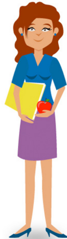
Écoles et garderies