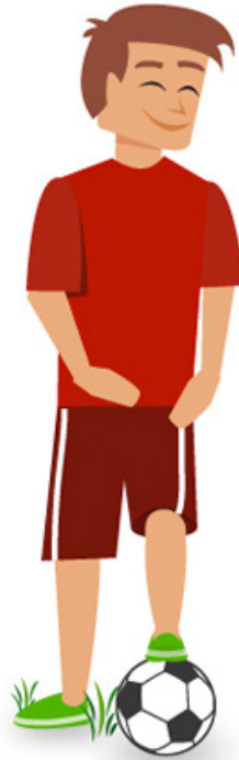
Équipes et clubs

Démarrez maintenant www.fundscrip.com 1-866-997-2747